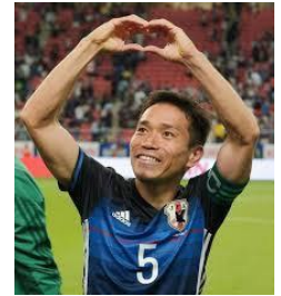
長友の（僕のアモーレ！）

愛を込めて ”使って タモーレ！” ～時間外対応の麻薬等保管金庫の設置場所の見直し～