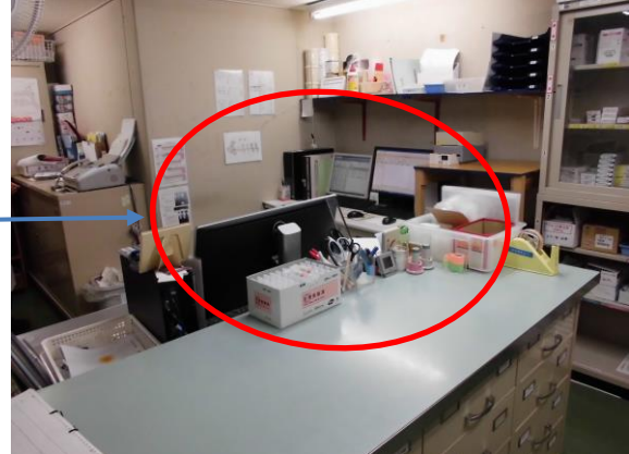
(電子カルテ・注射薬システムPC プリンター等)