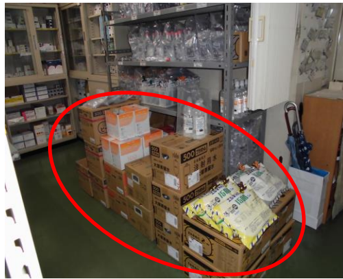
(狭い場所に輸液がたくさん保管されている)

注射室が狭くレイアウトが悪いため、輸液の保管場所や電子カルテ・プリンター等の配置に制限があった。よって、注射薬セット業務の効率が悪かった。