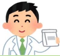
払い出し時の小袋

点眼・点耳薬の薬袋に記載された「患者名」、「使用回数・部位」の情報を、看護師が小袋に転記していた。 一度の処方で複数の点眼・点耳薬が処方されると、転記に時間がとられ、煩雑となっていた。